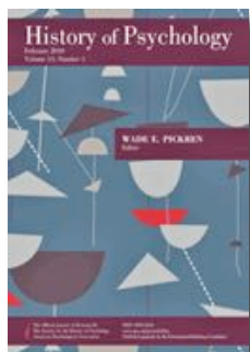
Fig 2 – History of Psychology

Até o dia 15 de Maio de 2017 , a Revista History of Psychology está com uma chamada de trabalhos aberta para a temática “ History of Psychology and Psychiatry in the Global World ”.